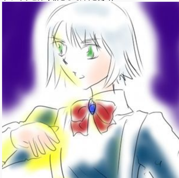
( 駒地真子 )