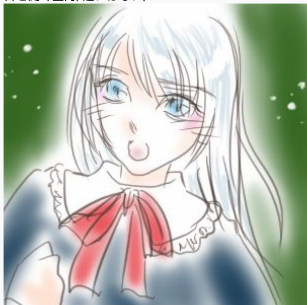
( 駒地真子 )